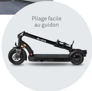
Pliage facile au guidon