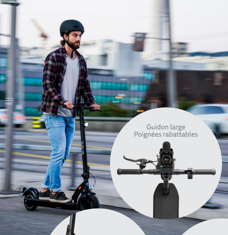
Guidon large Poignées rabattables